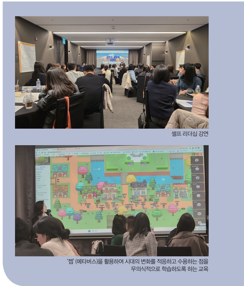
셀프 리더십 강연

이전과는 다르게 현재 리더십 교육들은 기업의 맞게 커스터마이징된 세상입니다. 리더분들의 Needs와 단계에 따라 그에 맞는 솔루션을 제공 받고, 원하는 방향에 맞게 성장하는 것을 원합니다. 저를 만난 고객사 담당자분들과 리더분들의 고객별 맞춤 과정을 통해 좀 더 가까이 다가가고자 합니다. 앞으로도 고객의 소리에 항상 민감하게, 그리고 최고의 가치를 지향하고자 노력하겠습니다.