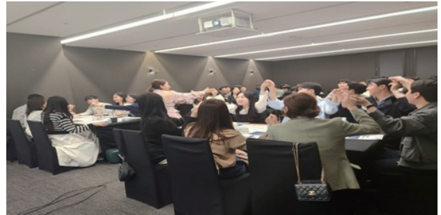
교육 사전에 라포형성과 교육 몰입 촉진을 위한 사전 레크레이션

리더십 워크숍이지만, 대상자의 직무와 경력, 학력이 다양하다 보니 교육 구성을 할 때 많이 고민하고 집중했습니다. 최대한 많은 교육생이 작은 인사이트 하나라도 가져갈 수 있도록 일방향적인 강의방식이 아닌, 액티비티와 실습, 게임 에피케이션을 활용하며, 그 안에 주요 역량과 셀프리더십 내용을 적절히 터치할 수 있도록 focus를 맞췄습니다.