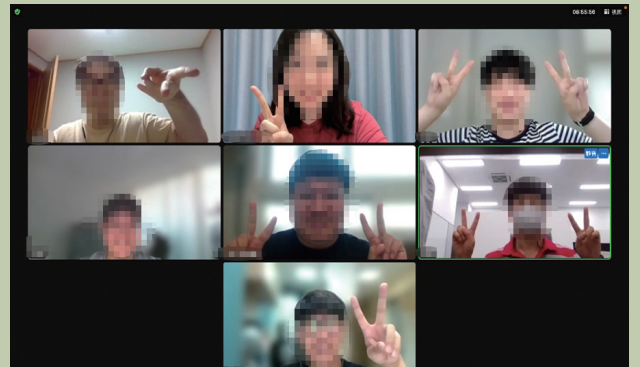
중국어 진이빙 강사님 마지막 수업날 단체 사진