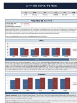
과정 종료 이후 학습자분들께 전달하는 개별 레포트

더불어 레벨에 따라 반이 나누어지며 제대로 분반이 이루어지지 못하면 학습자분이 수업을 수강하는데 어려움이 있기 때문에 기존 OPIc 점수와 사전레벨테스트 SPAC ^ , 부서와 팀, 그리고 성별에 따라 최대한 다양하고 레벨에 맞는 반을 나누기 위해 노력하였습니다. 분반이 제대로 이루어 졌을 때 좀 더 맞춤형 과정이 이루어질 수 있기 때문에 좀 더 신경을 썼습니다.