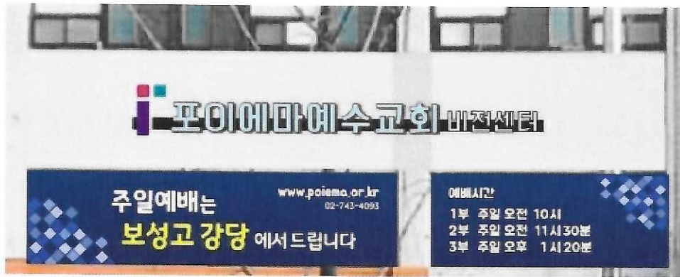
사진1. 사무실 간판 변경 및 창문 디자인(예시)